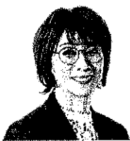
益子 直美さん バレーボール 元日本代表